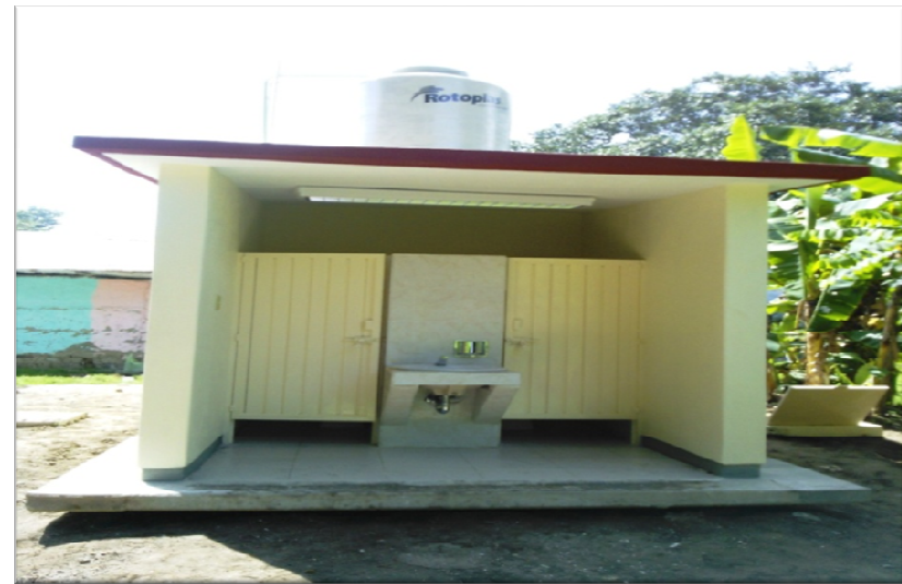
ESCUELA PRIMARIA INDIGENA EL NIÑO CAMPESINO EL OJITAL TANQUIAN DE ESCOBEDO, S.L.P. CONSTRUCCION DE UNA AULA DIDACTICA, ESTRUCTURA REGIONAL 6.00 X 8.00 M. MODULO DE SERVICIO SANITARIO TIPO RURAL Y OBRAS EXTERIORES