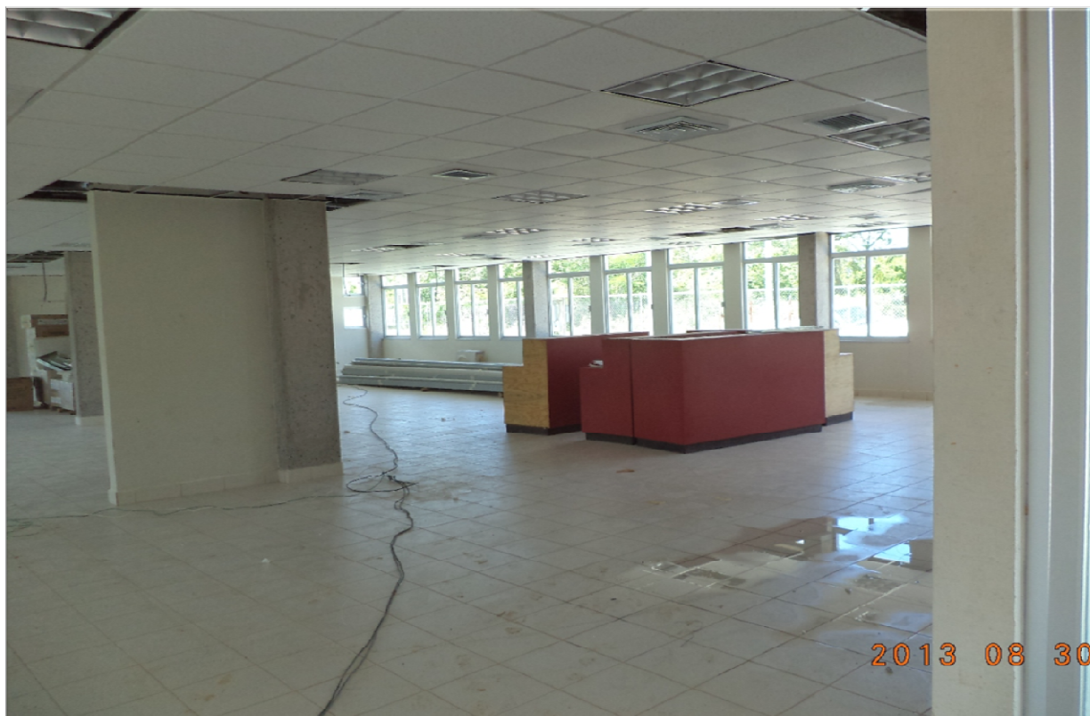
CENTRO DE DESARROLLO EDUCATIVO DE TAMAZUNCHALE HUATEPANGO TAMAZUNCHALE, S.L.P. CANCELERIA INTERIOR Y TERMINACIÓN DE RED DE VOZ Y DATOS