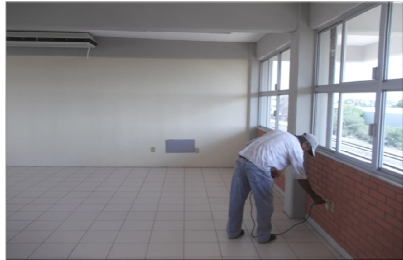
SECUNDARIA GENERAL PROFR. JUAN MANUEL MARTINEZ MENDOZA FRACC. AGUAJE 2000 SAN LUIS POTOSI, S.L.P. CONSTRUCCION DE TALLER DE COMPUTO 5 ENTRE EJES, ESTRUCTURA U-3C, 2o. NIVEL Y OBRAS EXTERIORES