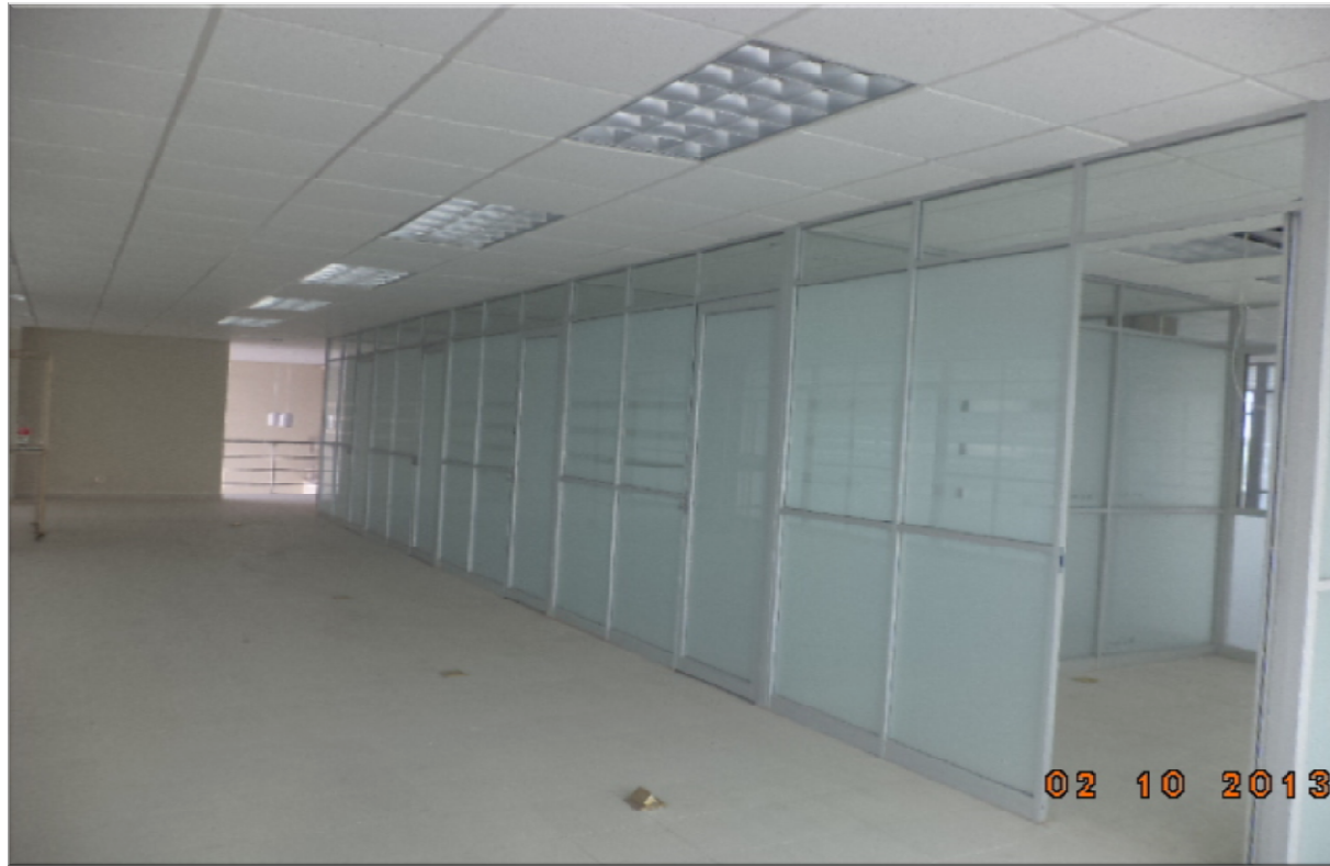
CENTRO DE DESARROLLO EDUCATIVO DE TAMUIN TAMUIN, S.L.P. CANCELERIA INTERIOR Y TERMINACIÓN DE RED DE VOZ Y DATOS