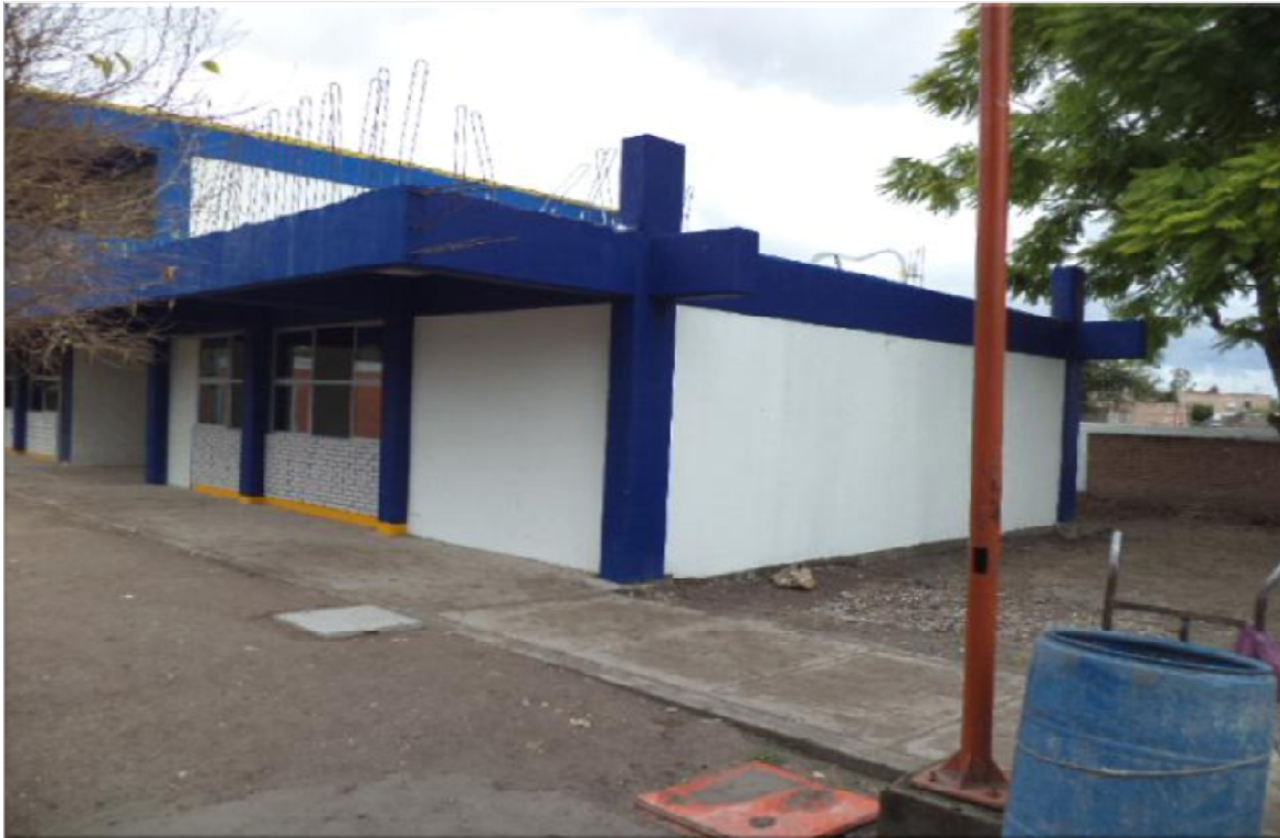
COBACH No.05 CIUDAD FERNANDEZ, S.L.P. CONSTRUCCION DE UN AULA DIDACTICA, 3 ENTREEJES, ESTRUCTURA U-2C PLANTA BAJA Y OBRAS EXTERIORES