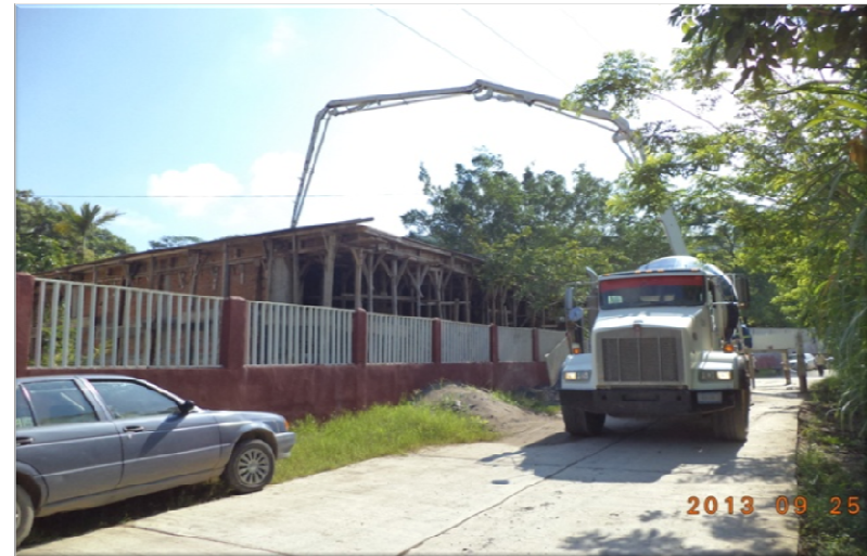
ESCUELA SECUNDARIA TECNICA No. 24 LA SOLEDAD TAMPACAN, S.L.P. CONSTRUCCION DE DOS AULAS DIDACTICAS DE 2 ENTREEJES CADA UNA, ESTRUCTURA U-1C Y OBRA EXTERIOR.