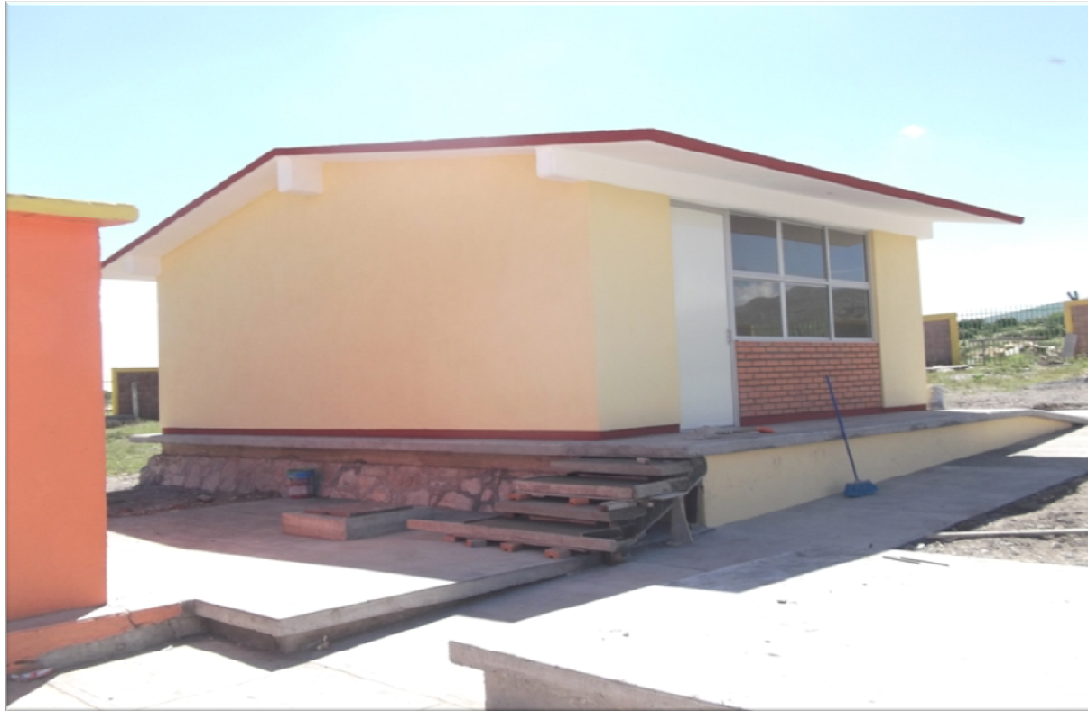
ESCUELA TELESECUNDARIA BENITO JUAREZ CINCO DE MAYO VENADO, S.L.P. CONSTRUCCION DE UNA AULA DIDACTICA, ESTRUCTURA REGIONAL 6.00 X 8.00 M. AISLADA Y OBRA EXTERIOR