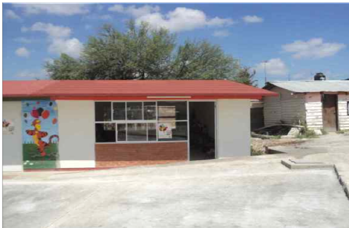
JARDIN DE NIÑOS INDIGENA "NIÑOS HEROES" EJIDO SAN JOSE, FRACCIONAMIENTO CIUDAD DEL MAIZ, S.L.P. CONSTRUCCION DE UN AULA DIDACTICA, ESTRUCTURA REGIONAL 6.00 X 8.00 M. AISLADA MODULO DE SERVICIO SANITARIO TIPO RURAL Y OBRA EXTERIOR