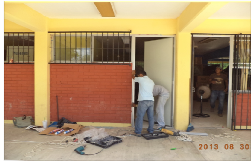
ESCUELA NORMAL DE LA HUSTAECA POTOSINA LA CUCHILLA TAMAZUNCHALE, S.L.P. REHABILITACIÓN DE SERVICIO SANITARIO