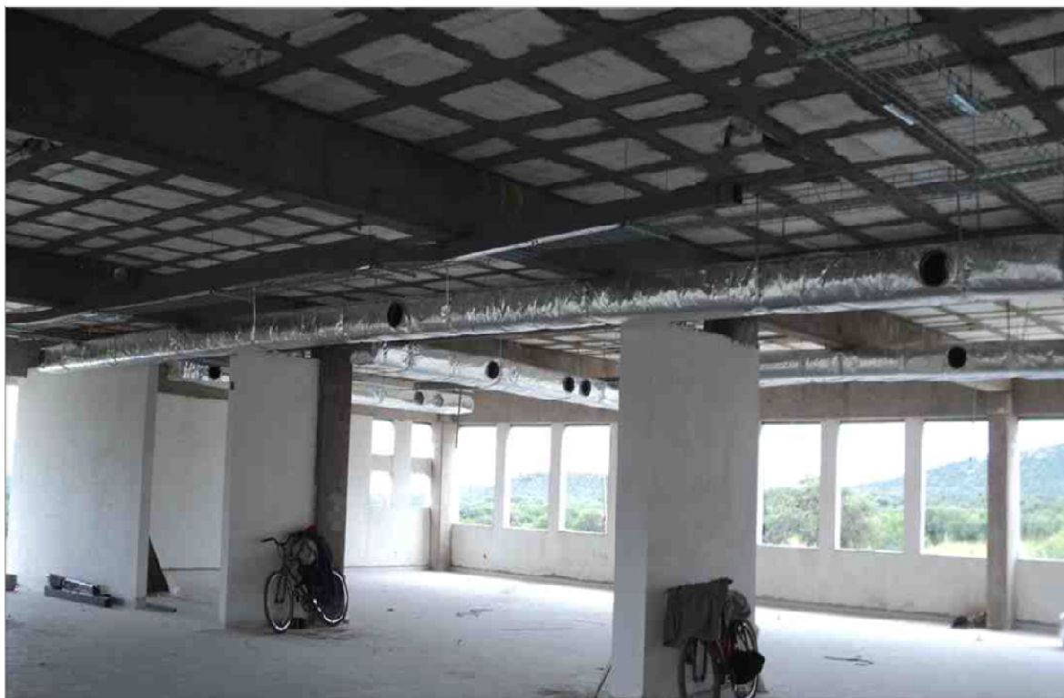
CENTRO DE DESARROLLO EDUCATIVO DE VILLA HIDALGO VILLA HIDALGO, S.L.P. CONCLUSION DE LA CONSTRUCCION DE LAS INSTALACIONES DEL CENTRO DE DESARROLLO EDUCATIVO DE VILLA HIDALGO