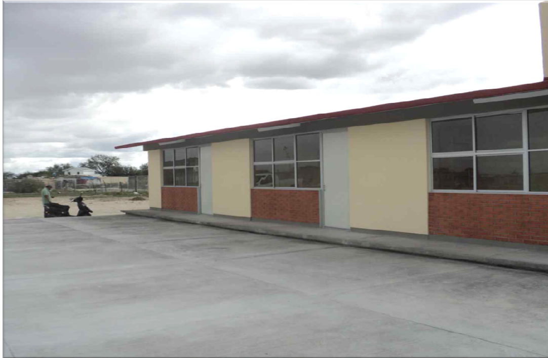
JARDIN DE NIÑOS NUEVA CREACION CEDRAL, S.L.P. CONSTRUCCION DE DOS AULAS DIDACTICAS, DIRECCION Y SERVICIOS SANITARIOS ESTRUCTURA REGIONAL 6.00 X 8.00 M. Y OBRAS EXTERIORES