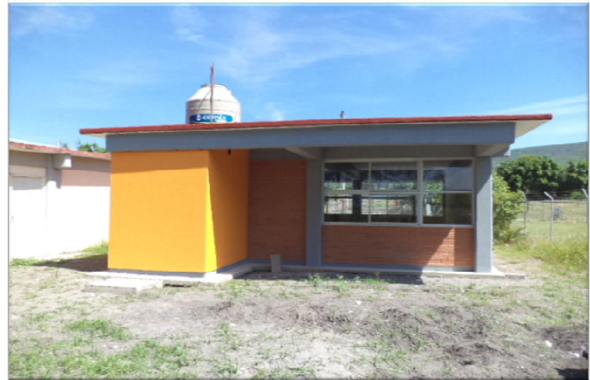
EDUCACION ESPECIAL CENTRO DE ATENCION MULTIPLE PROFRA. ESPERANZA LOPEZ CRUZ SAN CIRO DE ACOSTA, S.L.P. CONSTRUCCION DE UN AULA DE EDUCACION ESPECIAL DE 2 ENTREEJES CON SERVICIO SANITARIO, ESTRUCTURA U-1C AISLADA Y OBRA EXTERIOR