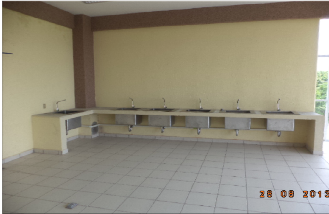
INSTITUTO TECNOLOGICO DE CIUDAD VALLES CIUDAD VALLES, S.L.P. TRABAJOS COMPLEMENTARIOS EN LA 1ra. ETAPA DEL EDIFICIO MULTIFUNCIONAL