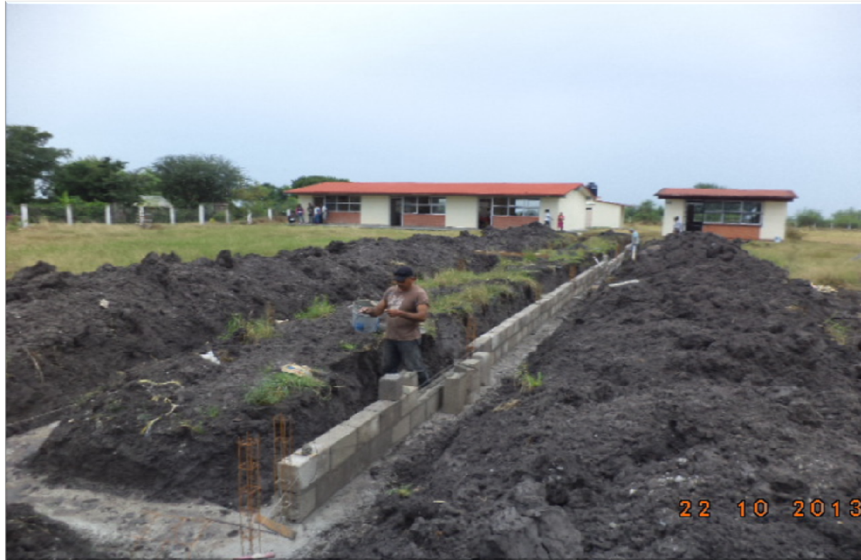
ESCUELA TELESECUNDARIA AGUSTIN YÁÑEZ PLAN DE IGUALA EBANO, S.L.P. REHABILITACION GENERAL DE LA INFRAESTRUCTURA EN LOS EDIFICIOS "F" Y "B" MAS OBRA EXTERIOR