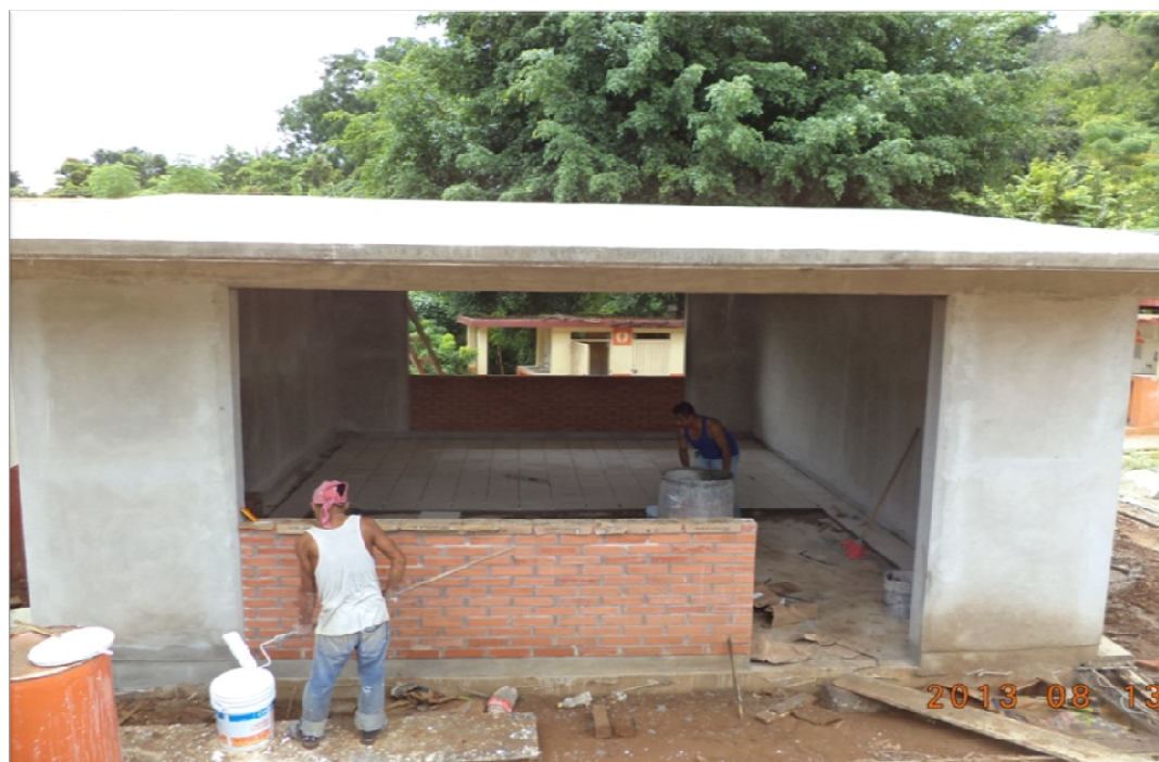
ESCUELA PRIMARIA MAESTRO IGNACIO RAMIREZ LAS CUEVAS AXTLA DE TERRAZAS, S.L.P. CONSTRUCCION DE UN AULA DIDACTICA ESTRUCTURA REGIONAL 6.00 X 8.00 M. Y OBRAS EXTERIORES