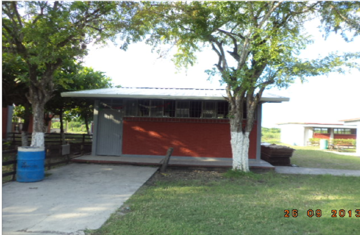
ESCUELA SECUNDARIA TECNICA No. 7 SAN VICENTE TANCUAYALAB, S.L.P. REHABILITACION GENERAL DE LA INFRAESTRUCTURA EN EL PLANTEL