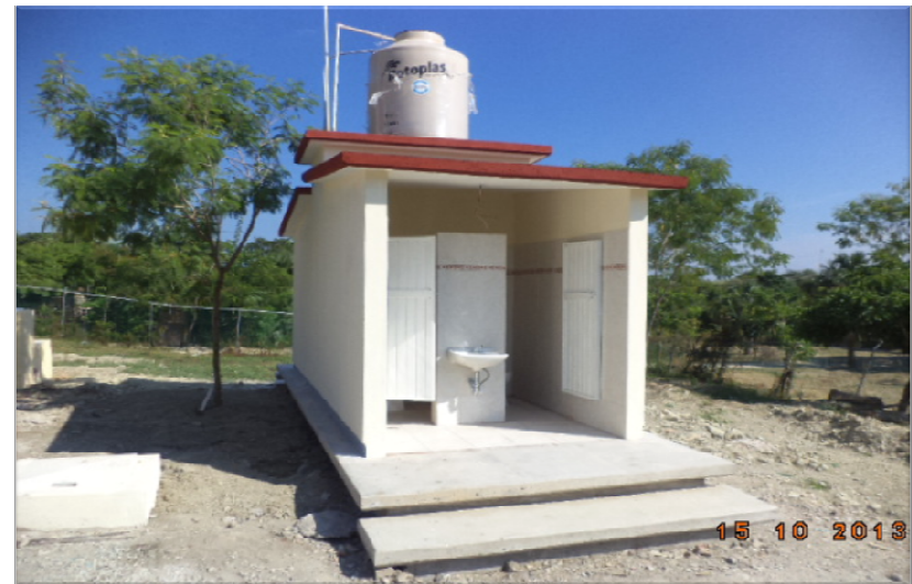
PRIMARIA NUEVA CREACION COLONIA CITLALMINA CIUDAD VALLES, S.L.P. CONSTRUCCION DE DOS AULAS DIDACTICAS, ESTRUCTURA REGIONAL 6.00 X 8.00 M. SERVICIO SANITARIO TIPO RURAL Y OBRA EXTERIOR.