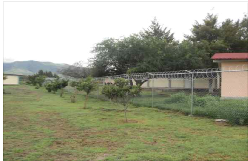
ICAT CIUDAD DEL MAIZ, S.L.P. CERCADO PERIMETRAL DE MALLA E IMPERMEABILIZACION DE LOSAS EN CUBIERTA