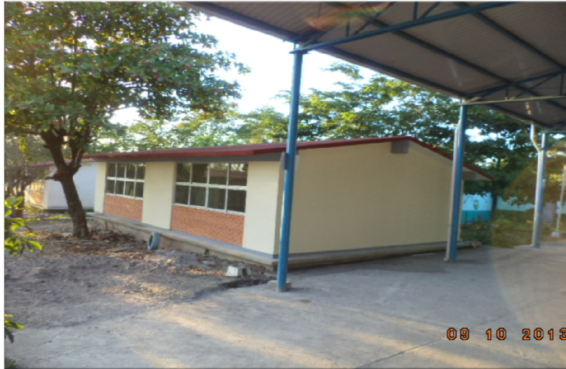
PRIMARIA JOSE MA. MORELOS COLONIA LOMA BONITA CIUDAD VALLES, S.L.P. CONSTRUCCION DE DOS AULAS DIDACTICAS, ESTRUCTURA REGIONAL 6.00 X 8.00 M. Y DEMOLICION DE CUATRO AULAS DEL EDIFICIO "F" Y OBRA EXTERIOR.