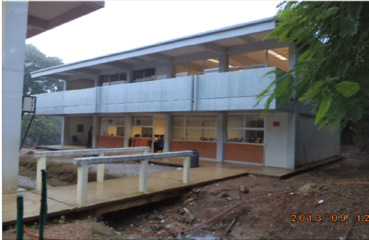
CECYTE VIII TEZAPOTLA TAMAZUNCHALE, S.L.P. CONSTRUCCIÓN DE DOS AULAS DIDÁCTICAS DE 2 ENTRE EJES CADA UNA, ESTRUCTURA U-2C, PLANTA ALTA, MÓDULO DE ESCALERA Y OBRA EXTERIOR