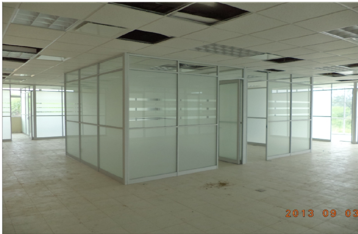
CENTRO DE DESARROLLO EDUCATIVO DE TAMPACAN TAMPACAN, S.L.P. CANCELERIA INTERIOR Y TERMINACIÓN DE RED DE VOZ Y DATOS