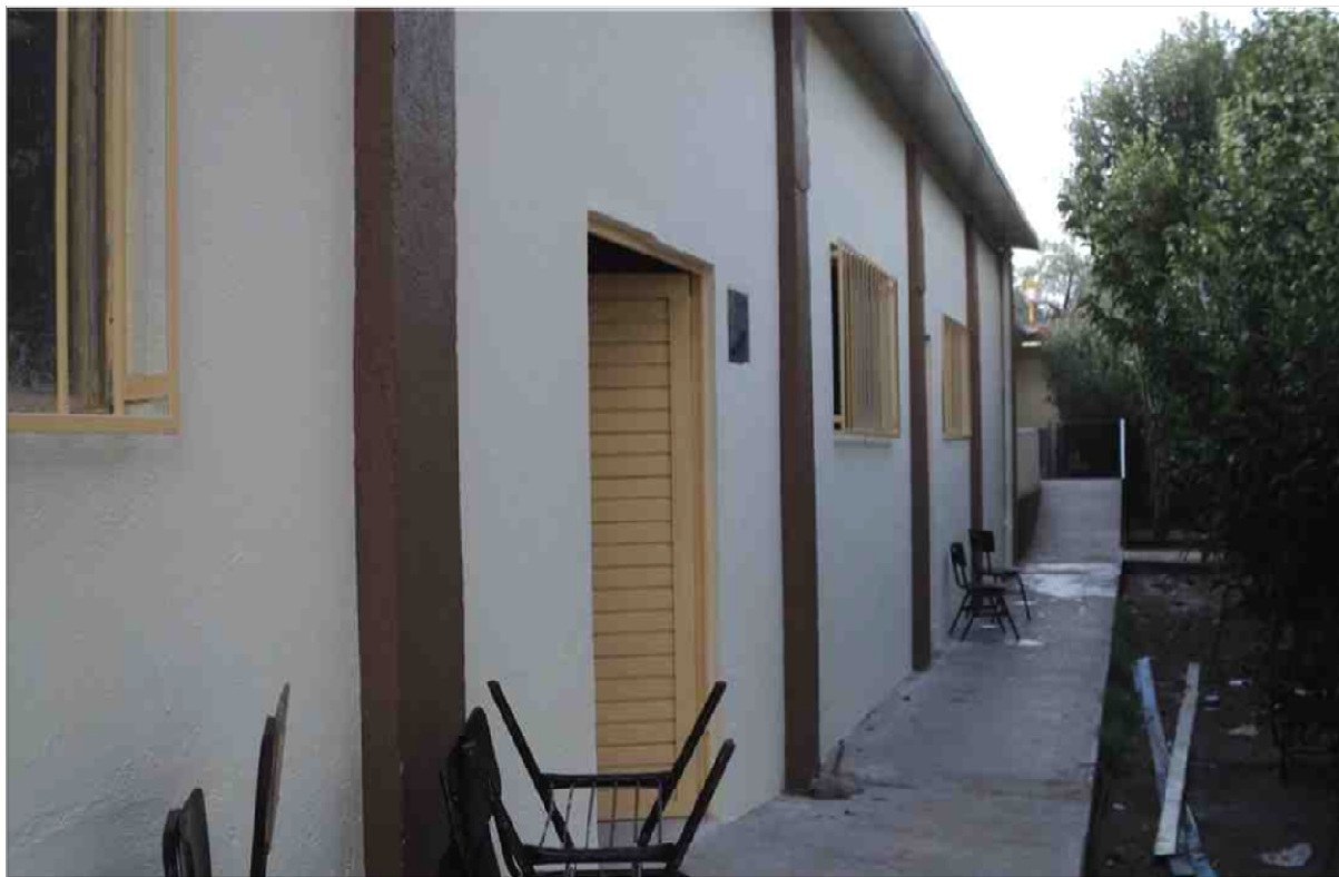
SECUNDARIA GENERAL FILOMENO MATA SOLEDAD DE GRACIANO SANCHEZ, S.L.P. REHABILITACION GENERAL DE LA INFRAESTRUCTURA EN LOS EDIFICIOS A Y B MAS OBRA EXTERIOR