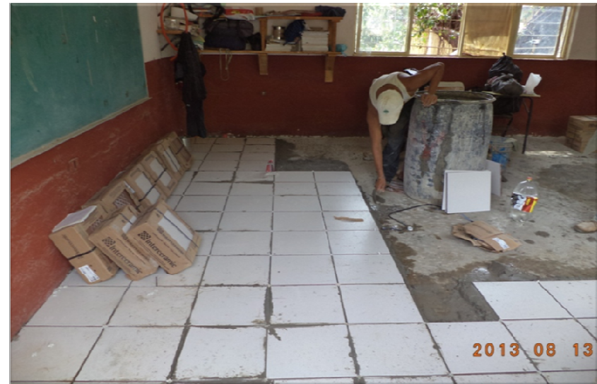
ESCUELA TELESECUNDARIA PONCIANO ARRIAGA LAS CUEVAS AXTLA DE TERRAZAS, S.L.P. REHABILITACION GENERAL DE LA INFRAESTRUCTURA FISICA DEL PLANTEL