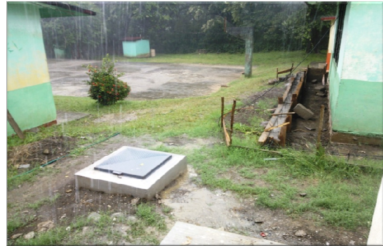
ESCUELA TELESECUNDARIA FRANCISCO GONZALEZ BOCANEGRA TOTOMOXTLA DOS (HUEXCO) TAMPACAN, S.L.P. DEMOLICION Y CONSTRUCCION DE MURO, CONSTRUCCION DE UNA AULA DIDACTICA, ESTRUCTURA REGIONAL 6.00 X 8.00 M. AISLADA Y OBRA EXTERIOR