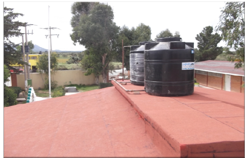
ESCUELA SECUNDARIA TECNICA NUMERO 53 EL ZACATON VILLA DE RAMOS, S.L.P. REHABILITACION GENERAL DE LA INFRAESTRUCTURA FISICA DEL PLANTEL EN EL EDIFICIO D, MAS OBRA EXTERIOR