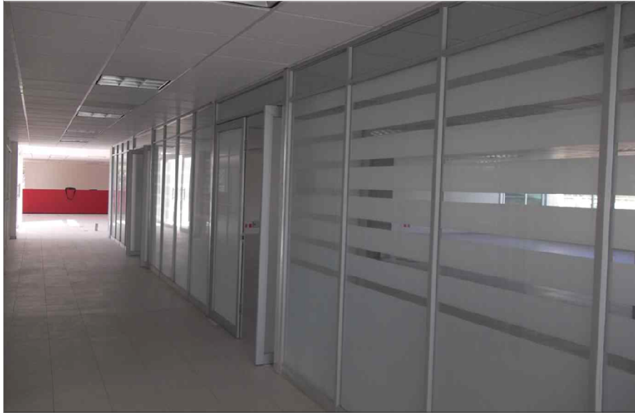
CENTRO DE DESARROLLO EDUCATIVO DE CEDRAL LA BOQUILLA CEDRAL, S.L.P. CANCELERIA INTERIOR Y TERMINACIÓN DE RED DE VOZ Y DATOS