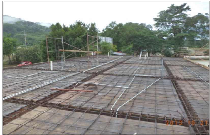
CENTRO DE INTEGRACION SOCIAL JUAN SARABIA MATLAPA, S.L.P. REHABILITACION GENERAL DEL PLANTEL